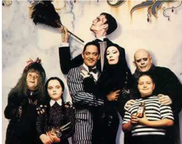
La Familia Adams

→ ¿Sabéis a qué hace referencia aquí?, ¿a qué película se refiere?