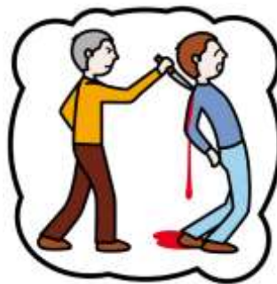
Limpiador de escenas del crimen