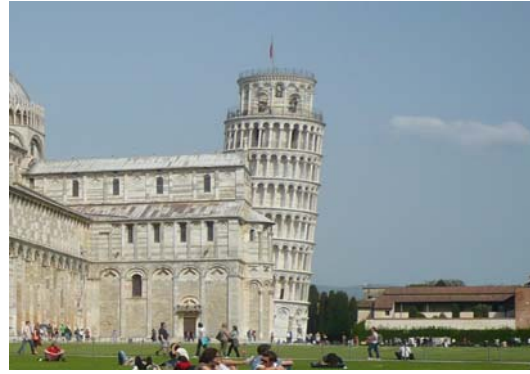
TORRE DE PISA